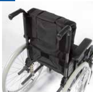
Respaldo acolchado con soporte lumbar Como estándar.