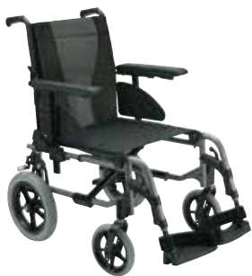
Versión Kit transit Ruedas de 12" neumáticas o macizas.