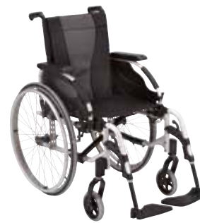
Color de chasis Blanco perla.