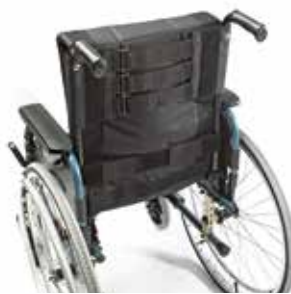
Respaldo acolchado Contour, ajustable en tensión con soporte lumbar (opcional) Para un posicionamiento óptimo.